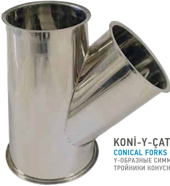
KONİ-Y-ÇATAL CONICAL FORKS Y-ОБРАЗНЫЕ СИММЕТРИЧНЫЕ ТРОЙНИКИ КОНУСНЫЕ

Y-ОБРАЗНЫЕ СИММЕТРИЧНЫЕ ТРОЙНИКИ КОНУСНЫЕ